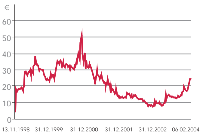
PEH-Aktienkurs vom 13.11.1998 bis 06.02.2004

raum ausnahmslos zu einer besseren Entwicklung und positiven Jahresergebnissen. Der PEH-Konzern hat mit einer Eigenkapitalrendite vor Steuern von 26,8 Prozent ein, im Vergleich zur Finanzbranche, sehr respektables Ergebnis in 2003 erzielt.